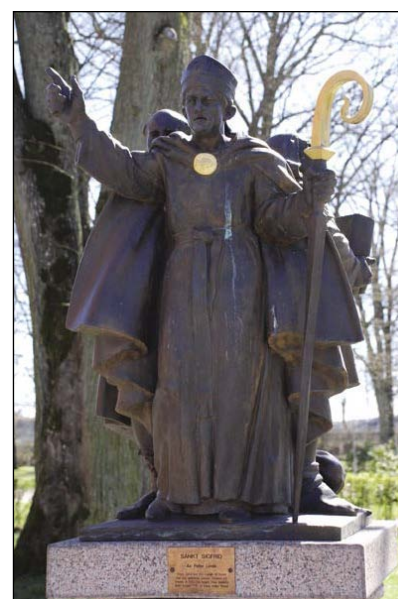
Sigfridsstatyn utanför Växjö domkyrka

Växjö utgjorde centrum för vördandet av den Helige Sigfrid som helgon, vilket än idag kommer till uttryck i Växjö kommuns vapen, som bär den Helige Sigfrids bild; där helgonet håller domkyrkan i vänster hand och kräklan i den högra. I