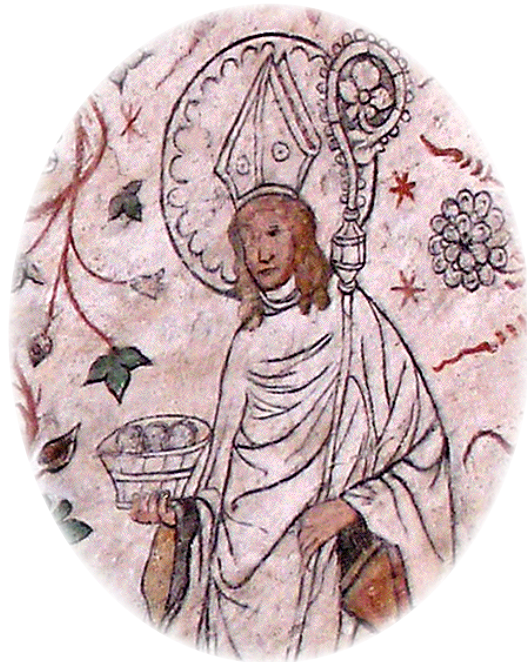
Fresk av den Helige Sigfrid i Överselö kyrka, Södermanland

Omslagsbild: Ikon av den Helige Sigfrid och martyrerna Unaman, Sunaman och Vinaman, målade i Heliga Philothei Ortodoxa kloster, 2014