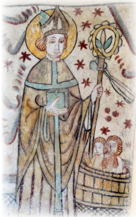
Götene kyrka, Västergötland

svävade mot stranden. Han undrade vad detta hade att betyda, drog skorna av sina fötter och vadade ut i vattnet. Under ljuslågorna upptäckte han då det flytande karet med martyrernas avhuggna huvuden. Karet hade inte sjunkit utan hållit sig flytande trots att det varit bundet vid en tung sten. Då bar Sigfrid alltsammans i land och skrinlade martyrernas huvuden i den kyrka, som martyrerna själva låtit bygga i Växjö. När man sedan avbildade den helige Sigfrid, så gav man honom